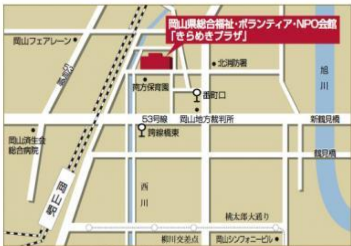
※ JR岡山駅から徒歩15分程度

◆ 会場所在地 岡山市北区南方2丁目13-1 岡山県総合福祉・ボランティア・NPO会館（きらめきプラザ）4階